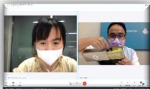
1 on 1 視訊洽談會

為協助本市廠商海外拓銷及爭取國際訂單，透過 拓銷媒合會 、 產品網頁 、 生技參展 等方式開拓國際市場，並宣介本市優勢產業與經商環境，提高城市產業能見度，藉此打造與國際城市產業交流及商機媒合之平台。