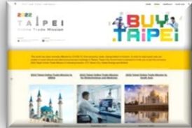
建置產品數位網頁